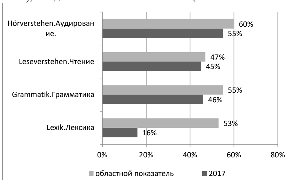
Рис. 2. Распределение успешности выполнения заданий обучающимися 10 классов по блокам содержания.

16% (53% областной показатель) и «Грамматика» 46% (55% областной показатель), и задания блока «Чтение» 45% (47% областной показатель).